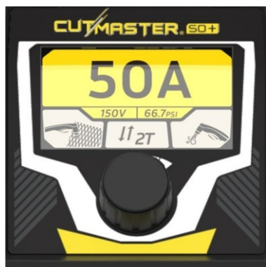
Jednoduchý a intuitivní TFT LCD panel

Navštivte esab.com , kde najdete podrobnější informace.